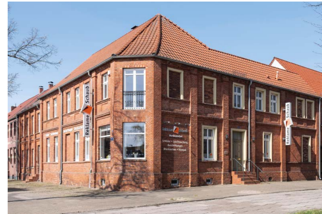
Das Werbeatelier befindet sich in der Bürgerstraße, Ecke Zimmerstraße.

der Aachtfarb-Digitaldruckmaschine für den Großformatdruck von Mimaki. Damit können Träger wie unterschiedliche Folien, Bannermaterialien und Papiere bis zu einer Breite von 1,60 Metern ohne Naht mit Fotos, Text oder Logos bedruckt werden.