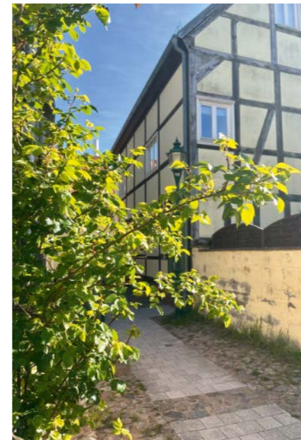
Der Rosenhof – die Geschichte, wie er zu seinem Namen kam, ist nicht genau belegt.

hinzü, die sofort hängen bleibt: »Sein Schwert, das Zeichen des Stadtrechtes und der Gerichtsbarkeit, war sogar schon einmal verborgen.« Mehr braucht es nicht, um Lottes Fantasie anzukurbeln. Von der Statue führt der Weg weiter durch die Stadt – oder besser gesagt: über die Stadt. Denn Perleberg wurde nicht ohne Grund in früherer Zeit das »Klein-Venedig des Nordens« genannt. Viele Wasserläufe der Stepenitz und zahlreiche Brücken prägten einst das Stadtbild. Eine davon ist die