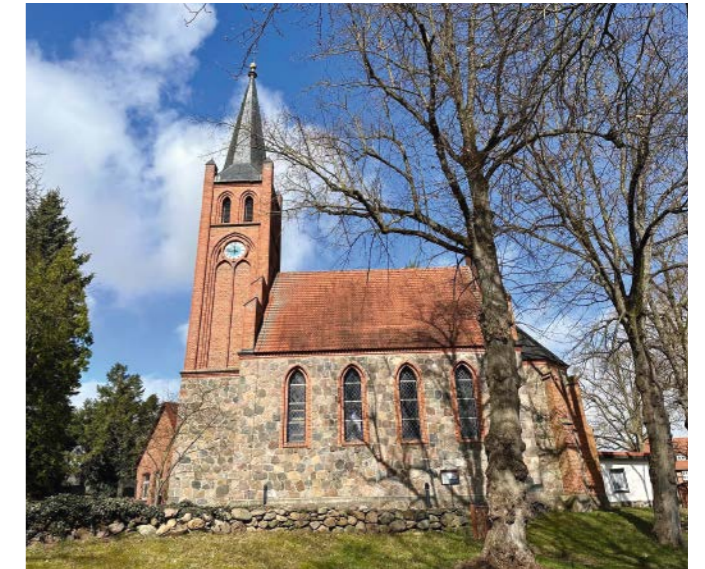
Die Kirche wurde 1861 errichtet, ersetzte den marode gewordenen Vorgängerbau.

Am Rand eines Feldes steht eine große, alte Rotbuche, deren ausladende Krone schon von Weitem zu sehen ist.