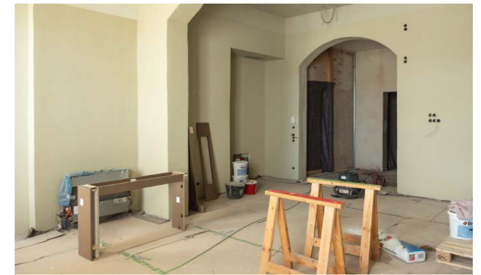
Noch haben die Handwerker in den Meetingräumen zu tun.

von jeweils 35 und 50 Quadratmetern. Der Säulensaal mit einer Fläche von 160 Quadratmetern bildet das Highlight. Alle Konferenzräume sind vollständig mit großen Monitoren und WLAN ausgestattet. »Die elektronische Ausstattung ist auf den neuesten technischen Stand gebracht«, erläutert die Standortmanagerin. Das passt zu Karl , denn er wird seine Projektideen geladenen Gästen präsentieren.