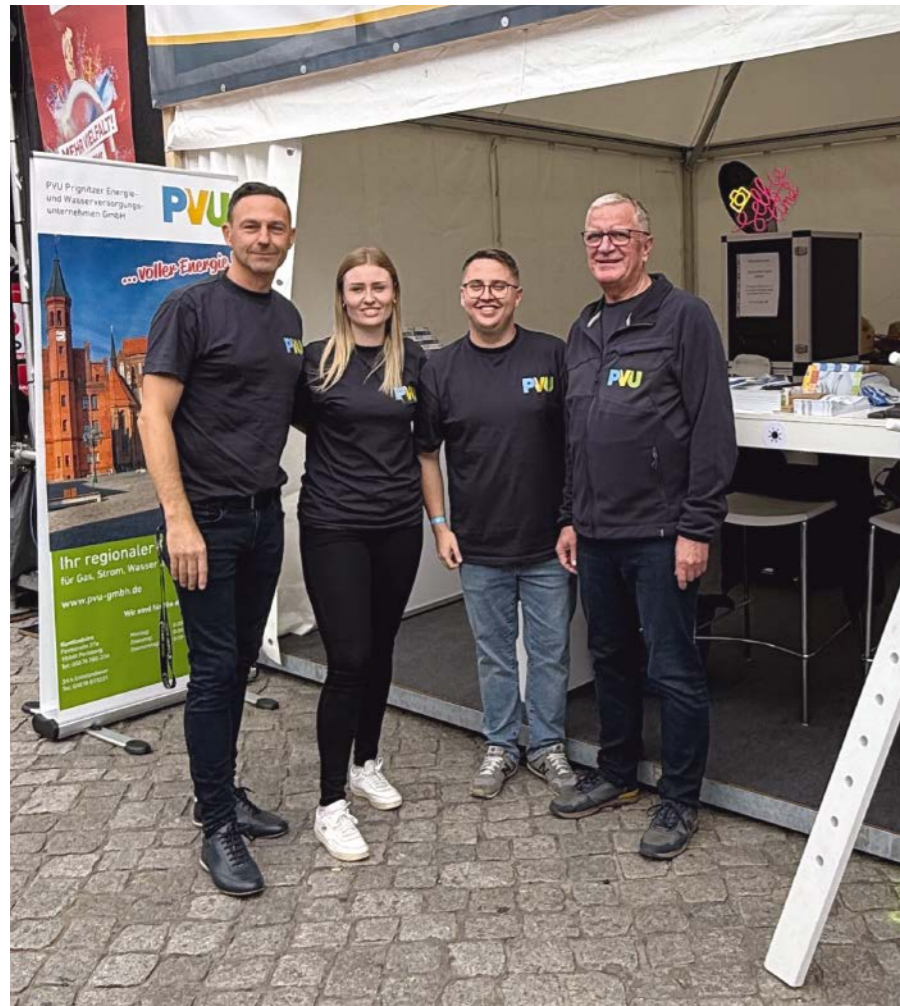
Die PVU bringt sich bei vielen Gelegenheiten in das gesellschaftliche Leben Perlebergs und der Region ein, wie hier beim Brandenburgtag 2025 in Perleberg.

hier vor Ort erklärt. Und auch jetzt kann er sie beruhigen: »Wir beobachten seit dem Februar 2026 steigende Gas- und Strompreise an den Energiebörsen. Allerdings hat PVU bereits für das laufende Jahr 2026 komplett und größtenteils auch für 2027 seine Gas-mengen preislich abgesichert«, sagt der Geschäftsführer. »Wir kaufen unsere benötigten Mengen bis zu zwei Jahre im Voraus ein, sodass kurzfristige Preiserhöhungen wie der Energiepreisschock Ende 2022 uns nur wenig aus der Ruhe bringen können.« Dieses bewährte Prinzip des Unternehmens habe den PVU-Kunden im Krisenjahr 2022 den günstigsten Preis aller Gasgrundversorger in Deutschland beschert. So mancher Kunde, der die PVU-Versorgung verlassen hat und zu einem »Discounter« mit Billigangebot gewechselt ist, hat seine Entscheidung später bereut, wenn das Lockangebot