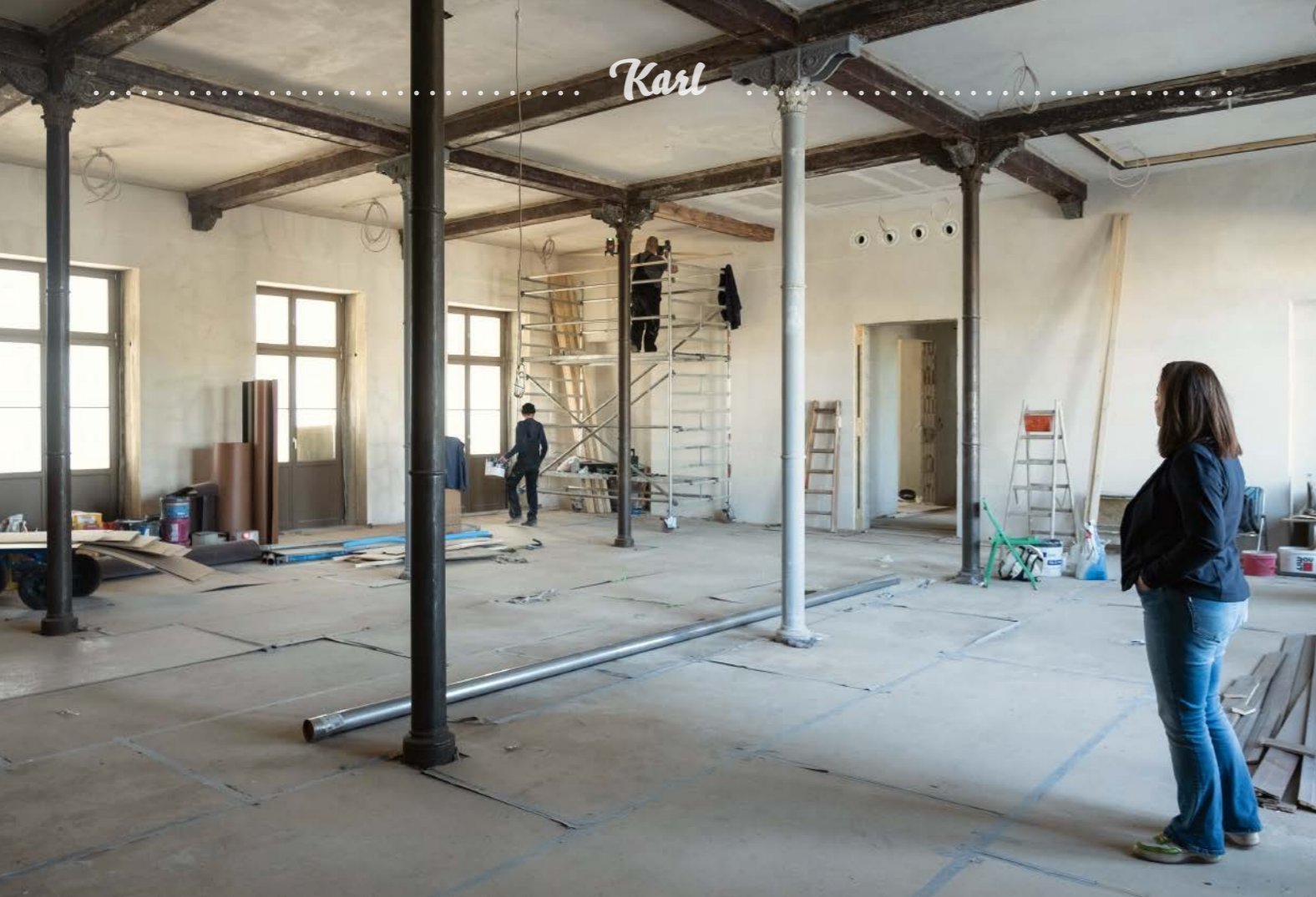
Der große Säulensaal wird das Highlight der Meetingräume.