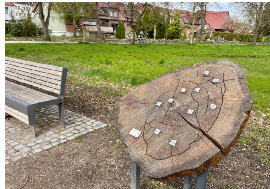
An einer Baumscheibe einer alten Eiche werden über QR-Codes per Smartphone zehn Perleberger Geschichten hörbar gemacht. Es gibt zwei solcher Baumscheiben im Stadtgebiet: am Bahnhof und hier im Hagen.